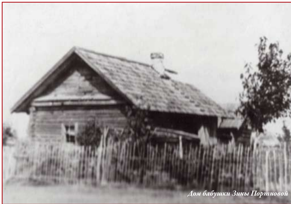
Дом бабушки Зины Портновой

Письмо это, маленький треугольник, до адресата шло полгода. Сейчас оно хранится в Центральном музее в Витеб-