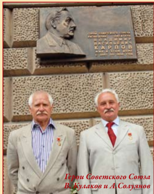
Герои Советского Союза В. Кулаков и А. Согуянов

По инициативе «Клуба Героев Москвы и Московской области» решением Правительства Москвы (при непосредственном участии Комитета общественных связей города Москвы и Департамента Культуры) была изготовлена и установлена мемориальная доска с бар-