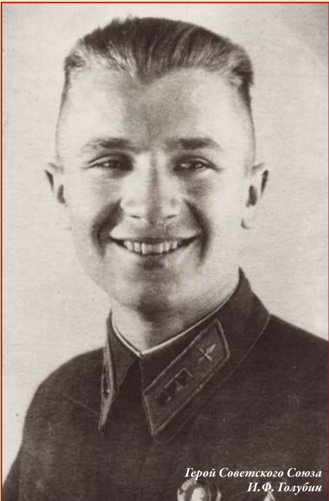
Герой Советского Союза И.Ф. Голубин