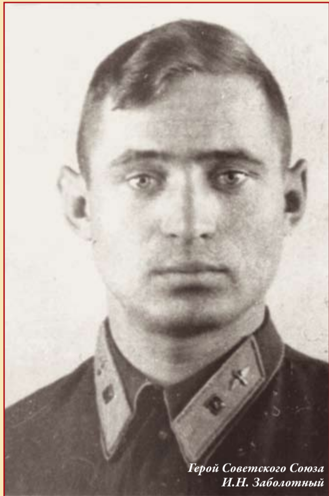
Герой Советского Союза И.Н. Заболотный