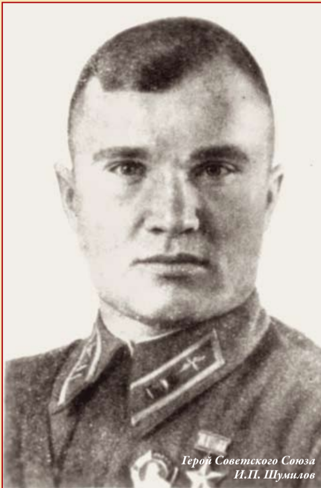
Герой Советского Союза И.П. Шумилов

Мы все в неоплатном долгу перед теми, кто стоял насмерть, но не пропустил врага к сердцу нашей родины, городу-Герою — Москве (Маршал Советского Союза Г.К. Жуков).