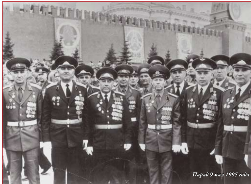
Парад 9 мая 1995 года