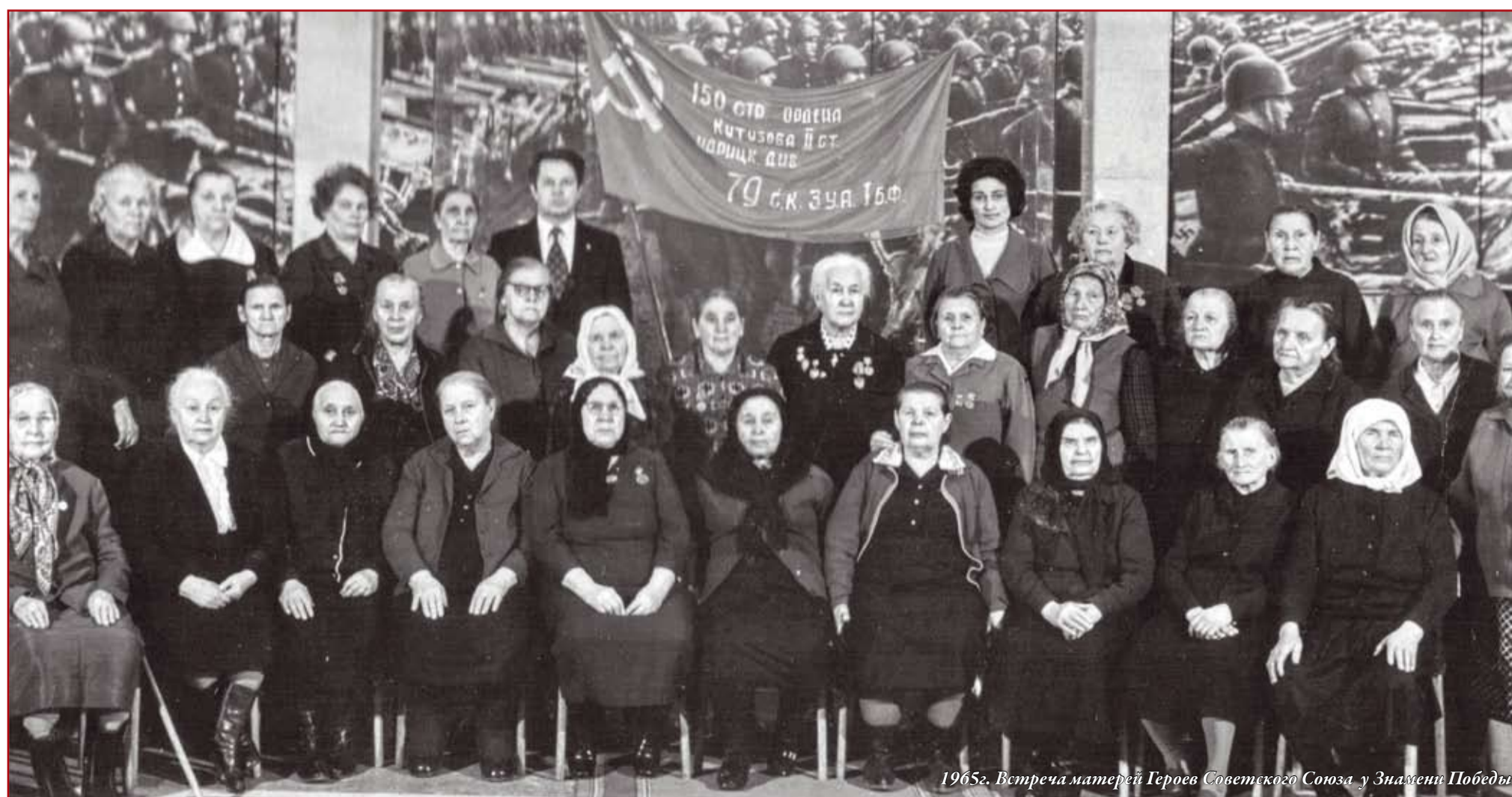
1965г. Встреча матерей Героев Советского Союза у Знамени Победы